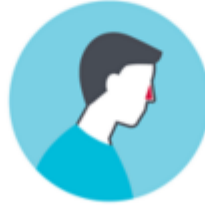
فقد حاسة الشم